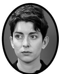
SECRÉTAIRE GÉNÉRALE ARTISTE