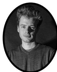
VICE - PRÉSIDENT CO-FONDATEUR ARTISTE