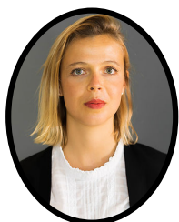
PRÉSIDENTE CO-FONDATRICE AVOCATE