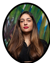
RELATIONS ÉTUDIANTS AVOCATE

Au cours de ses deux premiers mois de service, l'association a recruté trente-cinq étudiants en droit de la propriété intellectuelle et trente-six avocats, tous bénévoles, et a géré une trentaine de demandes d'artistes bénéficiaires.